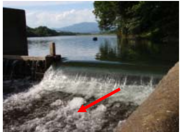
(写真 - 2)

(写真 - 1) 橋の上から見た魚道出口(コンクリートの叩きとなっている: 湧水時の様子)