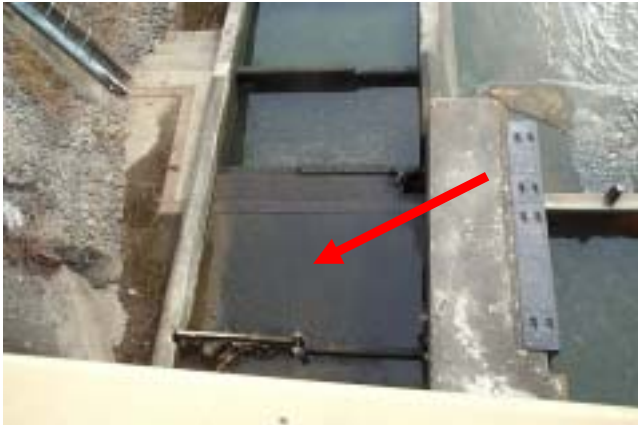
(写真 - 1)